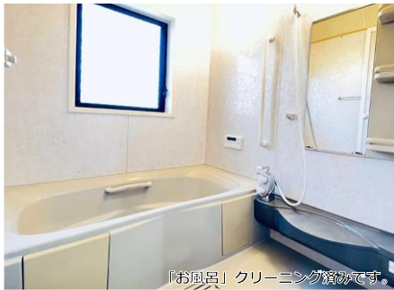
「お風呂」クリーニング済みです。