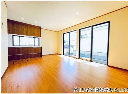
約15帖の開放感のあるLDK