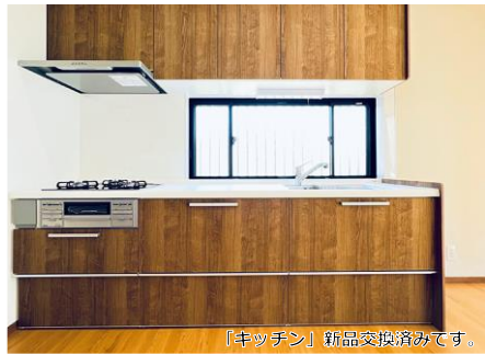
「キッチン」新品交換済みです。